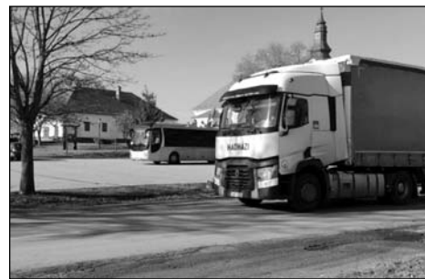
A községen haladó teherfogalom megkeseríti a lakók életét.

Az épület berendezései a helyükre kerültek, a tárlatok anyagának rendszerezése rövidesen elkezdődik. A nagyberuházások mellett a LEADER program ke-