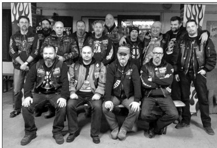
A motorosok számára fontos, hogy a jó ügyek mellé állva segítsék a rászoruló embereket