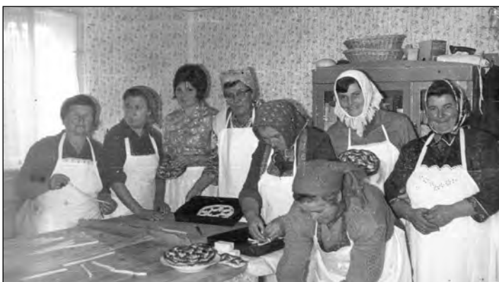
Kulcsos kalács készítése

Mélyen tisztelt Násznagy úr, tudja-e ki vagyok? Mi tőrés-tagadás, házasulandó vagyok. Voltam lánynézőben Isten tudja hányszor. Vőlegény is voltam egynéhányszor. Azt hiszem, ismerik édesapámat, Szegény feje egyszer elvette anyámat.