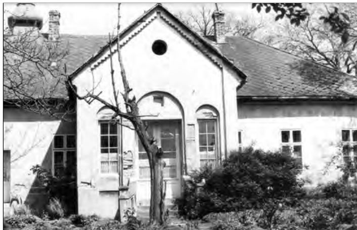
A Parókia udvar felőli homlokzata 1960-ban