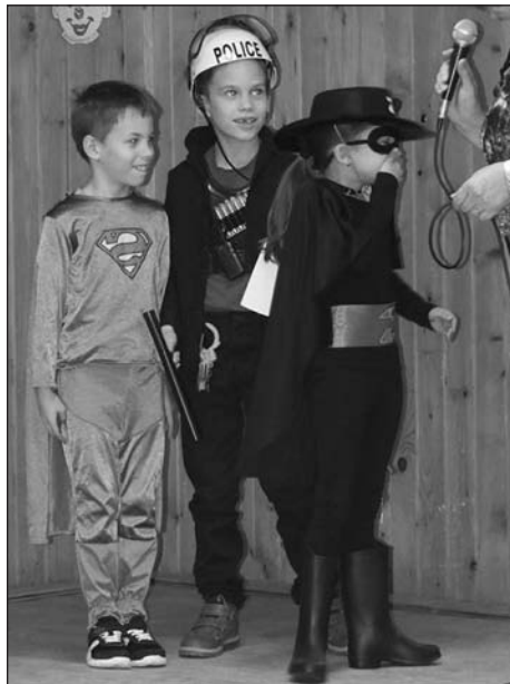
Volt a díjazottak között Superman, rendőr és Zorro...