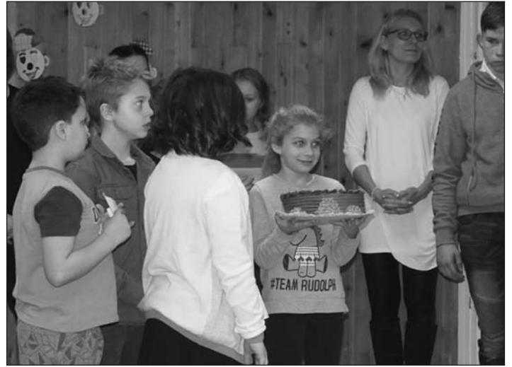
A díjkiosztás izgalmai