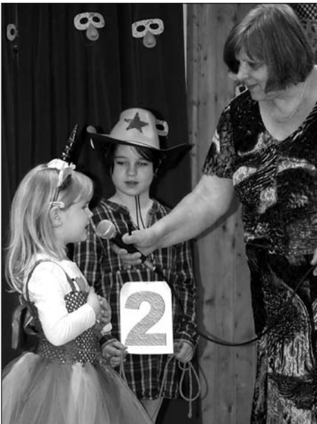
Volt cowboy helyett cowgirl, aki egy unikornist vezetett. Az utóbbi volt a bőbeszédű...