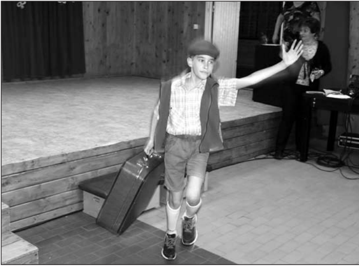
Itt az utas, aki lekéste a pontosan érkező vonatot