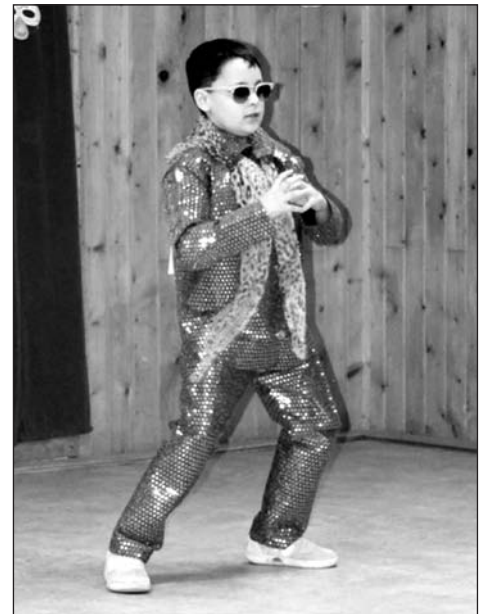
És egyéniben a legnagyobb sikert japán vendégünk érte el

A tombolán sok értékes nyermény talált gazdára. Köszönet illeti érte minden támogatónkat. Köszönjük a szervezőknek, segítőknek, résztvevőknek a sok kellemes élményt!